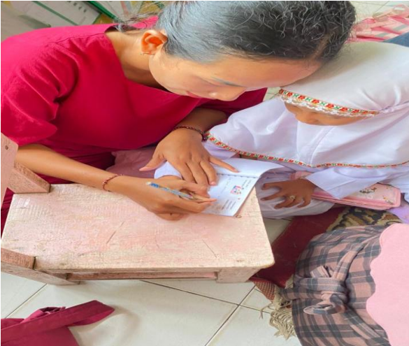
Gambar 5. Orang tua menuliskan cerita yang diceritakan anak.