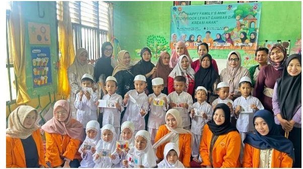
Gambar 8. Foto bersama peserta kegiatan menunjukkan hasil karya mini storybook