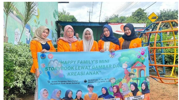
Gambar 9. Foto Tim Pengabdian.