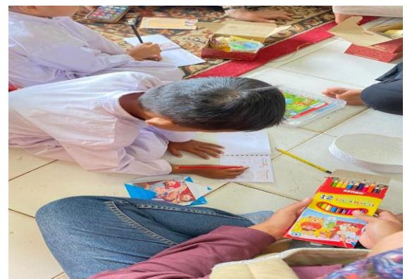
Gambar 4. Anak menggambar isi mini storybook

menggambar anggota keluarga, atau aktivitas bersama keluarga sebagaimana yang di tampilkan dalam Gambar 4 . Orang tua membantu menuliskan cerita yang diceritakan anak yang di tampilkan pada Gambar 5 . Hasil observasi menunjukkan bahwa anak mampu menuangkan ide secara spontan dan natural, sementara orang tua memberi dukungan dengan membantu menyusun alur dan menuliskan narasi berdasarkan cerita lisan anak. Tim pengabdian memberikan pendampingan ringan, memastikan orang tua tidak mendominasi proses kreatif anak. Kerja sama keduanya terlihat harmonis, anak menjadi lebih komunikatif, dan orang tua tampak menikmati proses mendampingi, sebagaimana yang ditampilkan pada Gambar 6 .