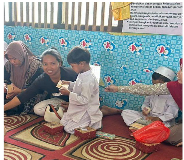
Gambar 7. Perwakilan anak membacakan hasil karya mini storybook

mereka menjelaskan isi gambar kepada orang tua dan tim. Perwakilan anak kemudian menampilkan karyanya di depan teman-teman sebagaimana ditunjukkan pada Gambar 7 . Hasil pengamatan menunjukkan anak tampak bangga dan percaya diri saat mempresentasikan buku buatan mereka. Orang tua memberikan dukungan verbal dan gestur positif, menciptakan suasana penuh apresiasi. Kegiatan menampilkan karya ini juga memperkuat hubungan emosional antara anak dan orang tua serta menumbuhkan rasa saling menghargai.