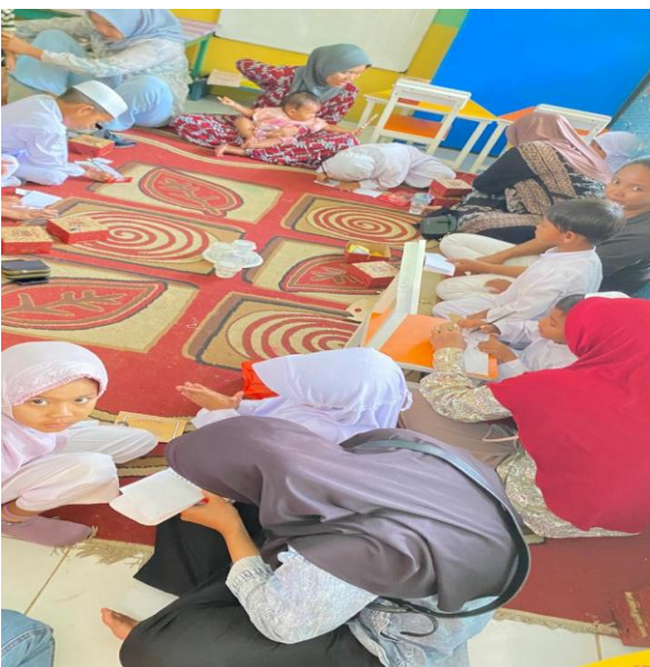
Gambar 6. Kolaborasi anak dan orang tua menyusun mini storybook .