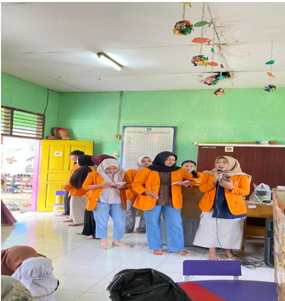
Gambar 2. Penjelasan Materi Singkat oleh Tim

menumbuhkan motivasi untuk mulai berkarya. Selain itu, orang tua mulai memahami bahwa kegiatan ini bukan sekadar tugas menggambar dan menulis, tetapi juga sarana untuk membangun kedekatan emosional serta kemampuan berbahasa anak.