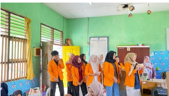
Gambar 3. Penjelasan Alur Pembuatan Mini Storybook