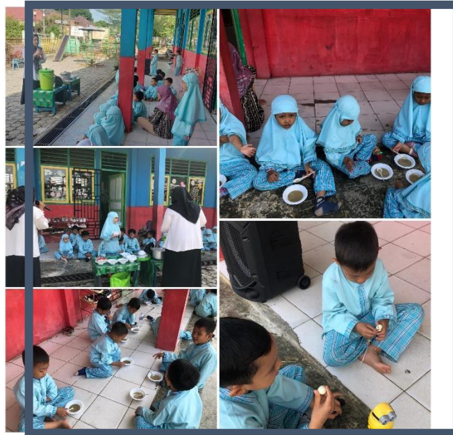
Gambar 3. Makan bubur kacang bersama

Dari kegiatan makan bersama di atas anak bisa menambah pengetahuan mengenai berbagai makanan sehat dan bergizi serta manfaatnya bagi kesehatan tubuh yang tentunya menjadi perhatian dari semua pihak, baik guru, orang tua dan juga anak. Makan bersama adalah salah satu cara yang patut di kembangkan karena akan menumbuhkan berbagai manfaat yang baik dari segi kebersamaan dan kesehatan. Karakter anak dalam menerapkan hidup sehat bisa ditanamkan oleh guru saat berada di sekolah, keluarga di rumah atau lingkungan dan teman-temannya. Tujuan peyelenggaraan makan bersama ini yaitu agar anak memiliki pengetahuan dan mempraktekkan cara makan bersama dengan tata cara yang sesuai dan benar.