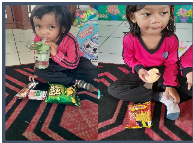
Gambar 1. Bekal yang dibawa berupa snack

Observasi pertama, peneliti menemukan ada beberapa anak yang membawa bekal yaitu snack/makanan siap saji di TK Dharma Wanita Persatuan Sarolangun. Dengan adanya hal tersebut, berarti masih ada beberapa orang tua yang memberikan makanan snack kepada anaknya tanpa mengetahui kandungan zat gizi yang ada di dalam nya.