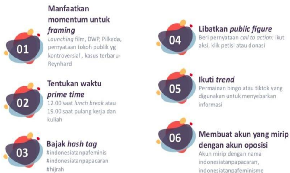
Gambar 1. Skema Strategi khusus KOMPAKS Sumber : KOMPAKS, 2020

menjadi seorang agen tidak memiliki pantauan akan suatu lingkungan yang didasarkan akan sifatnya yang aktif. Berkaitan dengan adanya hubungan dialektik antara relasi agen-struktur dalam penelitian kali ini. Agen yang dimaksud dalam hal ini adalah KOMPAKS selaku pihak masyarakat sipil yang menginisiasi terbentuknya RUU-PKS. Motivasi para agen (KOMPAKS) dalam membuat RUU-PKS tersebut guna mengakomodasi segala kepentingan yang berpihak pada korban kekerasan seksual. Berbagai elemen masyarakat yang tergabung dalam KOMPAKS memiliki spesialisasi kerja yang berbeda-beda dalam rangka mendukung pengesahan RUU-PKS. Dari mulai memberikan edukasi berupa pendidikan dan pelatihan, pemantauan terhadap kasus-kasus kekerasan seksual hingga sampai tahap pemulihan. Berbagai strategi telah dirancang sedemikian rupa oleh elemen masyarakat (KOMPAKS) tersebut sesuai dengan spesialisasi masing-masing. Strategi KOMPAKS dalam menghadapi tantangan eksternal dan internal pengawalan RUU-PKS yakni dengan membentuk tim kampanye. Tim Kampanye yang telah dibentuk oleh KOMPAKS ini memiliki strategi khusus sebagaimana sekama di bawah ini.