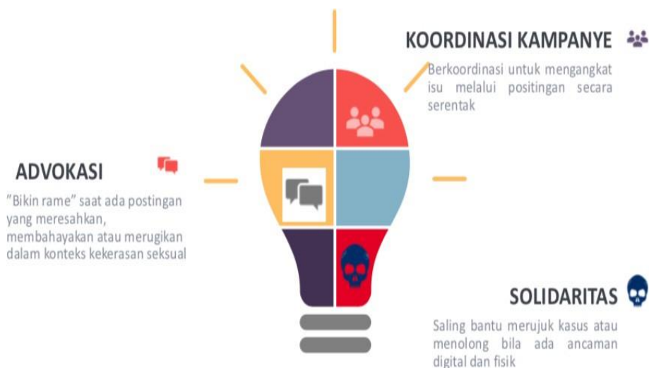
Gambar 2. Skema Tim Kampanye KOMPAKS