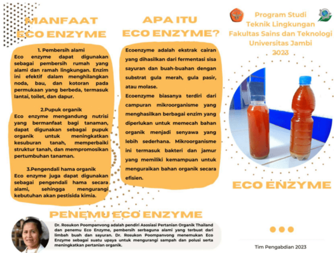
Gambar 6. Desain Brosur Sosialisasi Ekoenzim

Sebagai transfer ilmu bagi para peserta dan mengedukasi ibu-ibu mengenai pengelolaan dan pengolahan sampah, maka dalam kegiatan pengabdian ini juga diadakan workshop. Dari kegiatan pelaksanaan workshop ini diharapkan dapat : Memberikan pengetahuan dan wawasan tentang pentingnya pengolahan limbah padat domestik, khususnya limbah organik yang setiap hari dihasilkan dari kegiatan rumah tangga. Memberikan pengetahuan dan wawasan tentang eko-enzim. Eko-enzim merupakan salah satu produk dari pengolahan sampah yang sudah banyak dilakukan tetapi belum semua kalangan Masyarakat dapat memahaminya dengan baik dan benar.