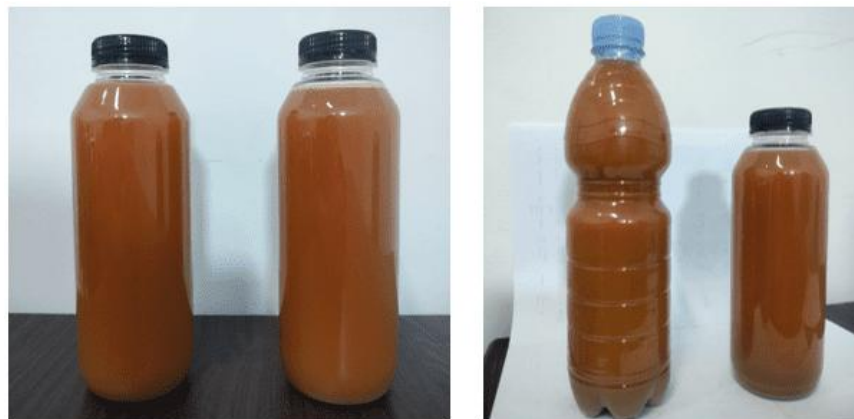
Gambar 3. Hasil Eko-enzim

Adapun materi yang disampaikan oleh tim pengabdian dalam workshop ini adalah tentang pengetahuan dasar eko-enzim, manfaat eko-enzim dan langkah-langkah pembuatan eko-enzim. Selain itu, dilaksanakan juga pelatihan/workshop pembuatan eko-enzim (Gambar 2). Peserta dari workshop ini adalah kelompok ibu-ibu yasinan Dusun Karya Maju, Muaro Jambi (Gambar 4). Pelaksanaan workshop ini diharapkan dapat menambah pengetahuan serta wawasan ibu-ibu di Dusun Karya Maju sehingga dapat diterapkan dalam kehidupan sehari-hari dan bahkan dapat meningkatkan pengetahuan dan kemauan dalam ikut berkontribusi mengolah sampah organik rumah tangga sendiri dan menjadi salah satu upaya pengurangan