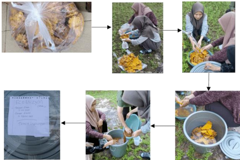
Gambar 2. Kegiatan Eksperimen Eko-enzim

Eko-enzim yang dihasilkan dalam pengabdian ini ditunjukkan dengan gambar 3. Eko-enzim dalam eksperimen pengabdian ini Sebagian besar menggunakan kulit buah nenas. Warna yang dihasilkan sebenarnya mengikuti warna kulit buah yang digunakan, serta bau yang muncul adalah bau asam karena eko-enzim sendiri sifatnya asam.