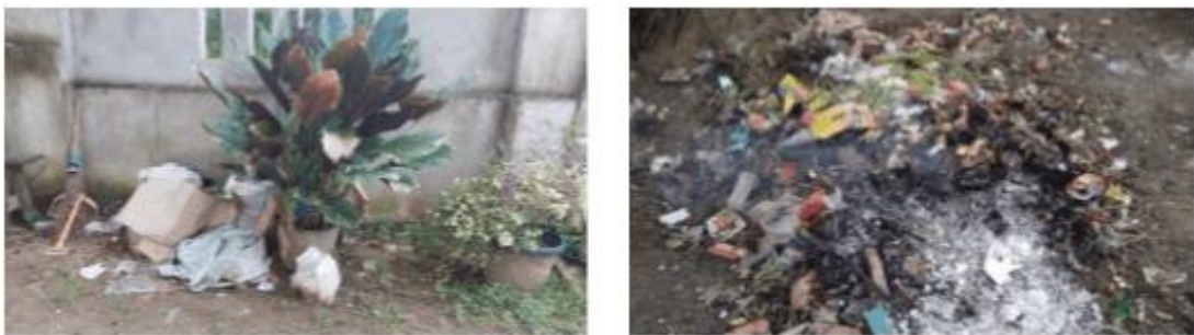
Gambar 1. Kondisi Sampah Masyarakat Dusun Karya Maju, Muaro Jambi

Masyarakat Dusun Karya Maju, Kabupaten Muaro Jambi, sehari-harinya mengelola sampah limbah organik rumah tangga dengan cara dibuang ke tempat penampungan sementara atau dibiarkan di lingkungan tanpa ada pemanfaatan lebih lanjut seperti yang terlihat pada gambar 1. Sampah organik yang dihasilkan dalam satu kawasan sangat berpotensi untuk diolah sehingga dapat mengurangi atau mereduksi sampah yang dibuang ke TPA dan TPA. Menurut perhitungan Widyawati, Rinaldi, and Laura tahun 2020 [4], potensi reduksi sampah basah/organik dapat mencapai 37,33%. Sampah limbah organik rumah tangga tersebut bisa diolah kembali dengan memanfaatkannya menjadi cairan eko-enzim.