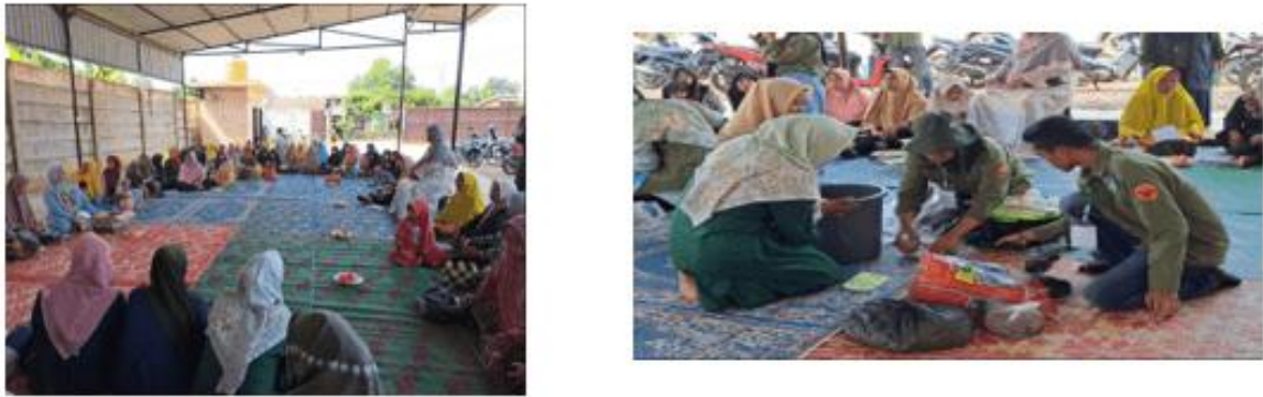
Gambar 4. Kegiatan dan Suasana Pelaksanaan Workshop

sampah dari sumbernya, dan juga bisa dimanfaatkan untuk meningkatkan pendapatan ibu-ibu di Dusun Karya Maju jika produk turunan eko-enzim yang dibuat dikomersilkan.