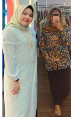
Gambar 2. Sebelum dan sesudah melakukan intermittent fasting (IF)