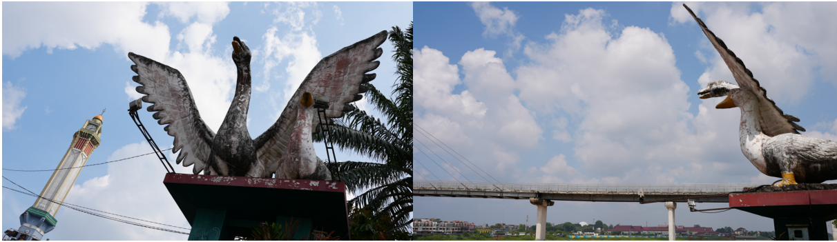
Gambar 2. Tugu Angso Duo Jambi Kota Seberang

Penelitian ini dilakukan di Kecamatan Pelayangan, Kota Jambi, Provinsi Jambi dengan objek penelitian adalah tugu Angso Duo yang terdapat di sekitaran kawasan Menara Gentala Arasy. Pemilihan objek penelitian tersebut didasari dengan keberadaan tugu Angso Duo yang ukuran dari objek penelitian yang cukup besar ukurannya, serta keberadaannya yang terletak di sekitaran kawasan Menara Gentala Arasy serta berada di sisi pinggir Sungai Batanghari. Hal tersebut menjadikannya sebagai bagian dari daya tarik tugu Angso Duo di Kota Jambi.