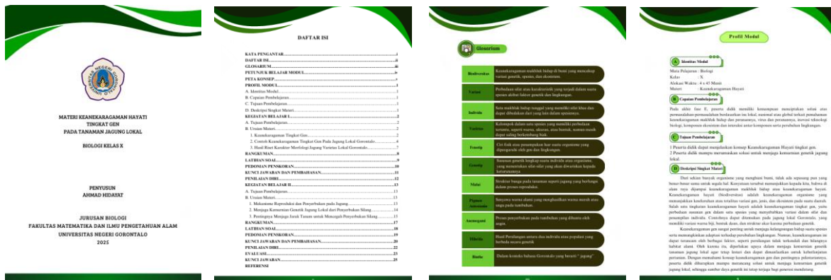
Gambar 3. Tampilan Isi Modul Pembelajaran

Gambar 2. Merupakan hasil desain akhir modul pembelajaran yang telah disempurnakan melalui proses revisi setelah validasi oleh ahli materi dan media. Desain cover dibuat untuk menarik perhatian dan mencerminkan isi modul secara visual.