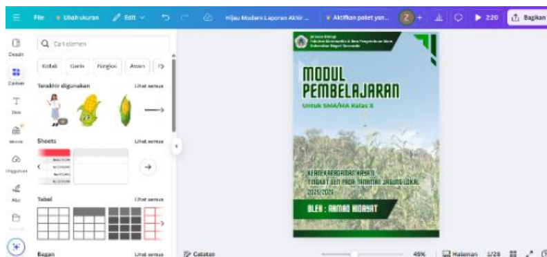
Gambar 1. desain modul pembelajaran pada platform Canva.

Tahap desain diawali dengan pemilihan media pengembangan, di mana Canva dipilih sebagai platform utama karena kemampuannya menghasilkan desain visual yang menarik, profesional, dan mudah disesuaikan. Struktur modul dirancang secara sistematis, meliputi sampul, kata pengantar, daftar isi, glosarium, peta konsep, profil modul, kegiatan pembelajaran, latihan soal, dan evaluasi. Gambar 1 menyajikan contoh desain modul yang dikembangkan menggunakan Canva sebagai media penyusunan.