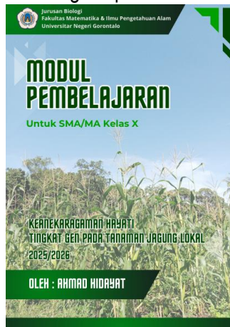
Gambar 2. Cover Depan Modul Pembelajaran

Pengembangan modul mengacu pada prinsip learner-centered , dengan kegiatan belajar dan latihan soal yang disesuaikan dengan level kognitif peserta didik.