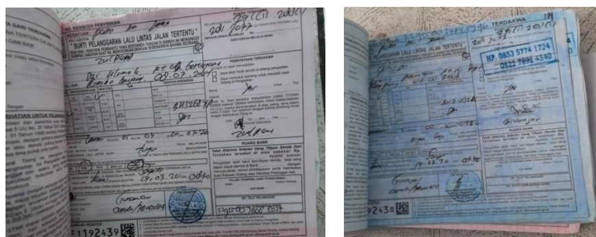
Gambar 1. 1 Dokumen Bukti Tilang Anak Dibawah Umur