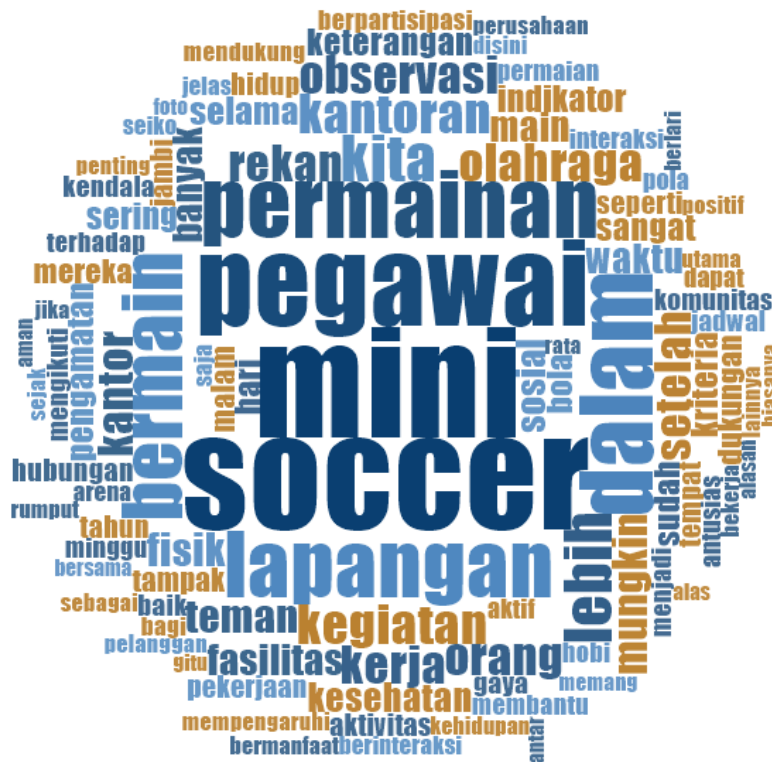
Gambar 1. Word Cloud Kata Yang Paling Sering Muncul Dari Data

Data wawancara dari kedelapan informan tersebut disusun dalam bentuk transkrip, kemudian di-import ke software NVivo 12 untuk selanjutnya dianalisis, dengan metode analisis tematik. Salah satu fitur software NVivo untuk menampilkan teks secara visual adalah Word Frequency Query . Fitur ini membantu peneliti menampilkan frekuensi kata-kata yang menarik dan informatif. Penjelasan ini dapat dilihat pada gambar 1 berikut ini.