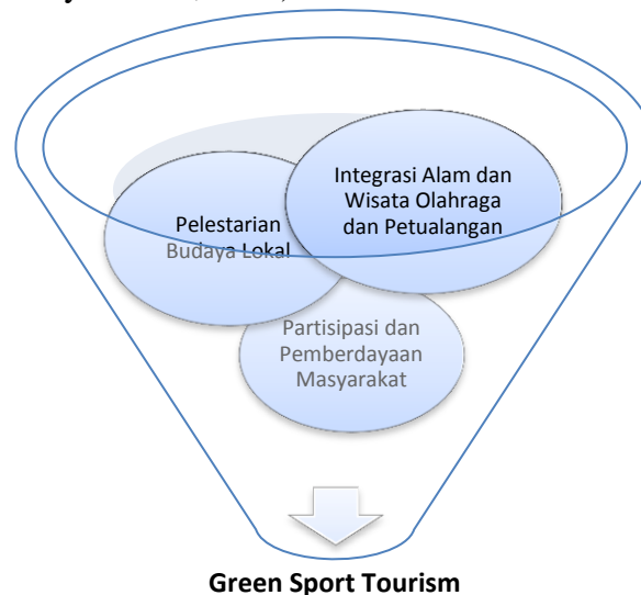
Gambar 3. Kerangka Strategis Pengembangan Green Sport Tourism Berkelanjutan

Kerangka konseptual pada Gambar 2 menunjukkan bahwa pengembangan green sport tourism dibangun melalui integrasi antara potensi alam, aktivitas olahraga petualangan, pelestarian budaya lokal, serta pemberdayaan masyarakat sebagai elemen utama pembangunan pariwisata berkelanjutan. Diagram tersebut menggambarkan bahwa keberhasilan green sport tourism tidak hanya berorientasi pada peningkatan jumlah wisatawan, tetapi juga pada upaya menjaga keseimbangan lingkungan dan keberlanjutan sosial ekonomi masyarakat sekitar. Integrasi alam dan wisata olahraga petualangan menjadi daya tarik utama yang mampu menciptakan pengalaman wisata berbasis ekologi sekaligus meningkatkan kesadaran konservasi lingkungan (Putra et al., 2026). Pada saat yang sama, pelestarian budaya lokal menjadi identitas khas destinasi sehingga mampu memperkuat nilai autentik kawasan wisata. Partisipasi dan pemberdayaan masyarakat ditempatkan sebagai fondasi penting karena masyarakat lokal memiliki peran strategis dalam pengelolaan, pelayanan, serta pengembangan ekonomi kreatif berbasis wisata (Deska et al., 2025). Dengan demikian, model konseptual ini menekankan pentingnya kolaborasi antara aspek lingkungan, budaya, olahraga, dan ekonomi masyarakat agar tercipta pengembangan pariwisata yang berkelanjutan, kompetitif, serta memberikan dampak positif bagi kesejahteraan masyarakat lokal (Nurhidayati et al., 2025).