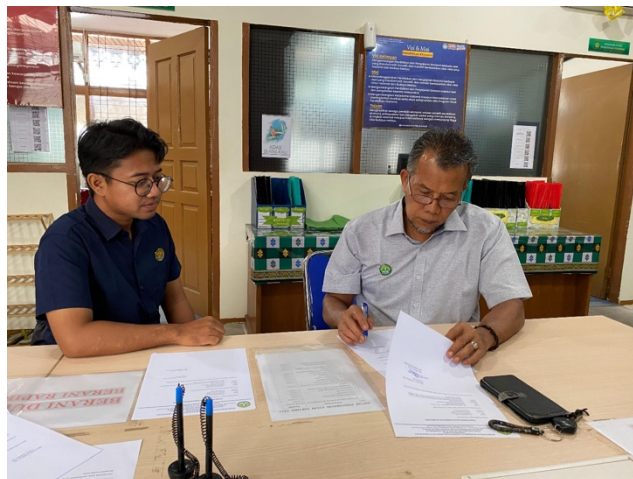
Gambar 1. Kegiatan diskusi untuk mengidentifikasi isu jurusan