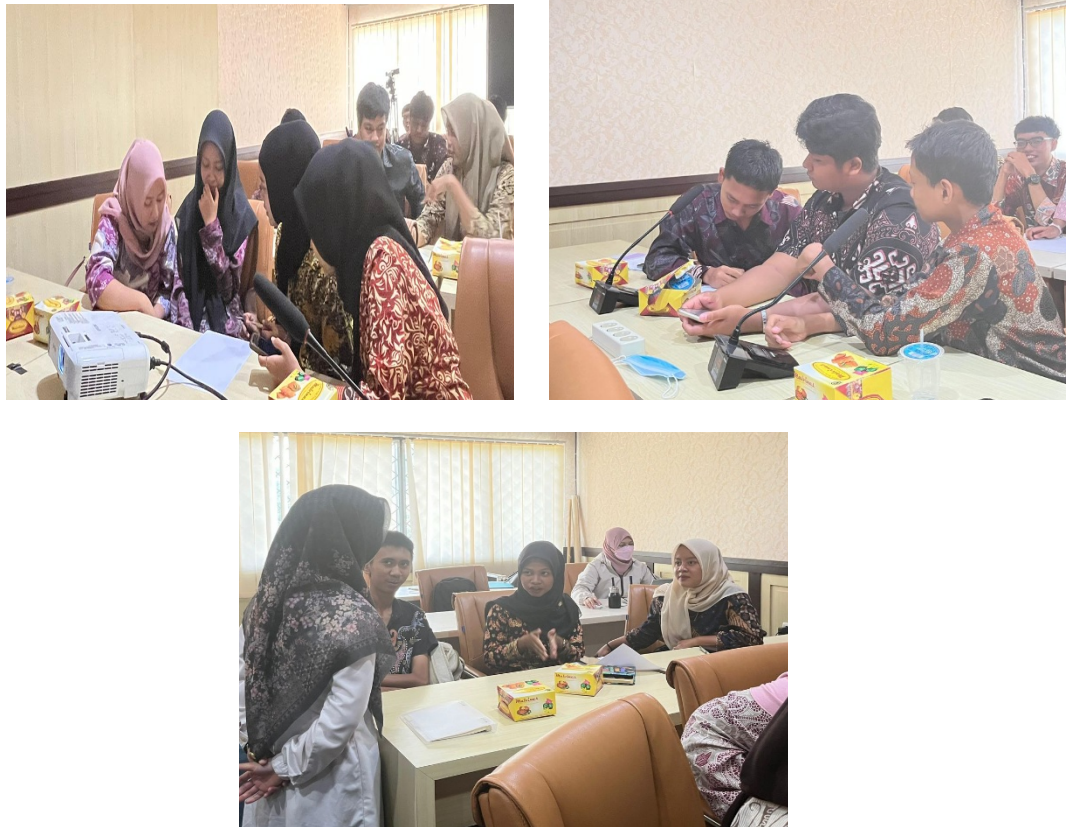
Gambar 4. Praktik Pembuatan Ice Breaking oleh masing-masing kelompok didampingi oleh dosen

Gambar 4 tersebut menunjukkan masing-masing kelompok sedang praktik menyusun ice breaking berbasis kearifan lokal Jambi. Adapun ice breaking yang disusun dapat berupa pantun, permainan tradisional, kuis kearifan lokal dan lain sebagainya sesuai kreativitas mahasiswa.