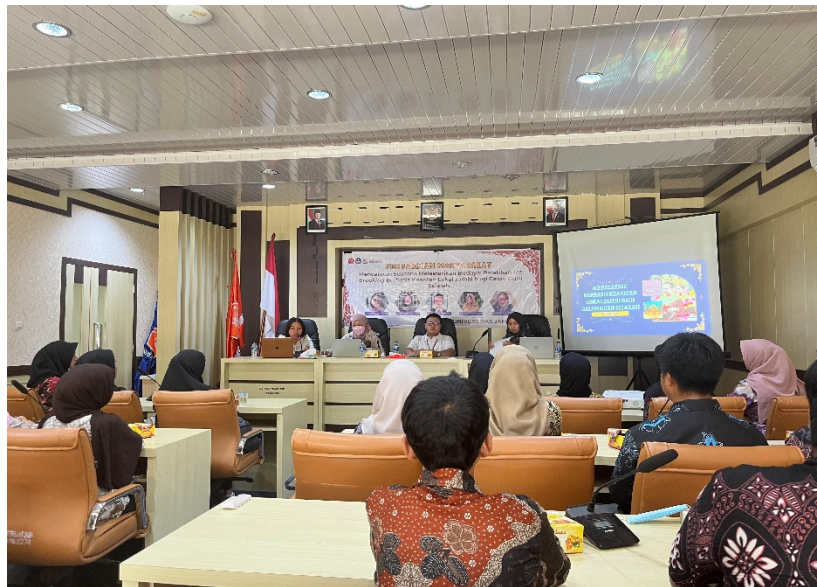
Gambar 7. Pelaksanaan Refleksi

Tahap refleksi merupakan bagian penting dalam kegiatan pengabdian masyarakat ini, karena menjadi momen bagi mahasiswa untuk meninjau kembali apa yang telah mereka pelajari selama proses pelatihan. Pada sesi ini, mahasiswa diajak untuk menyampaikan kesan, pengalaman, maupun pemahaman baru yang mereka peroleh. Refleksi dilakukan baik secara lisan melalui diskusi kelompok maupun secara tertulis melalui lembar evaluasi singkat. Dengan demikian, setiap mahasiswa memiliki kesempatan untuk mengutarakan pendapatnya secara terbuka.