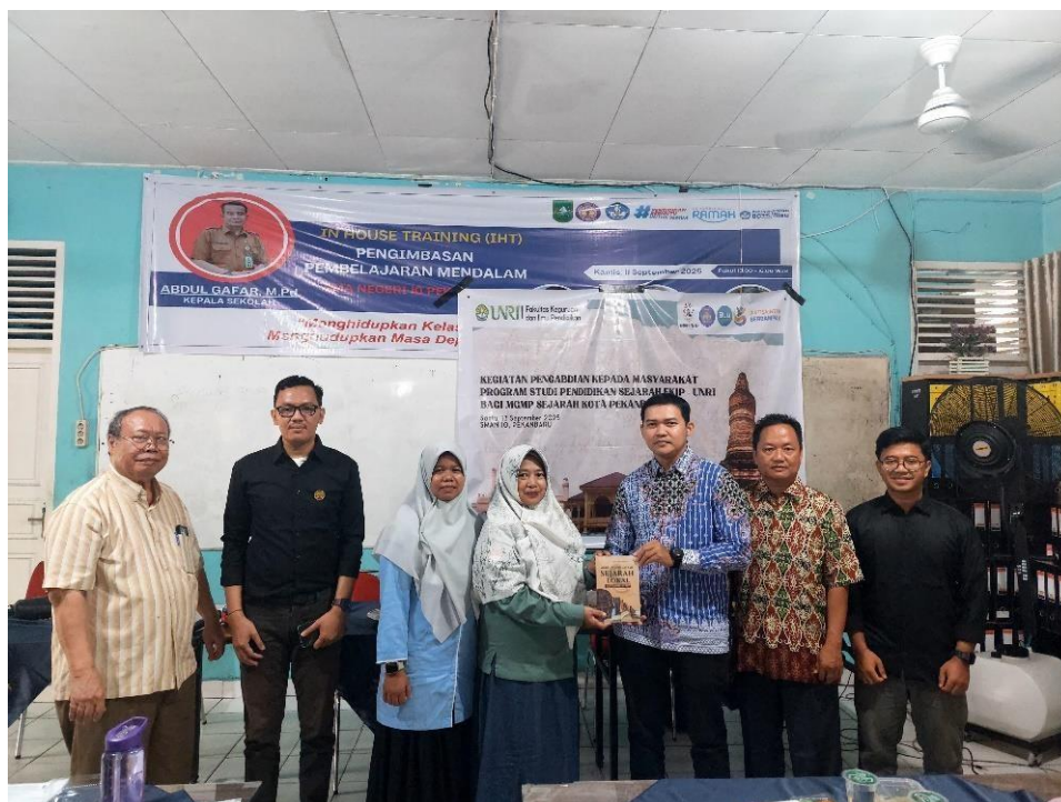
Gambar 2 Penyerahan Plakat dari Ketua MGMP Sejarah kepada Koordinator Prodi Sejarah FKIP Universitas Riau

Pada kegiatan pelaksanaan pengabdian, peserta juga diajak untuk memahami dan mengenal website-website yang menyediakan sumber sejarah. Peserta juga berlatih untuk mengakses website-website tersebut. Pelaksanaan pengabdian melibatkan seluruh peserta untuk aktif dalam menggunakan atau mempraktekkan langsung dalam menelusuri sumber-sumber sejarah berbasis digital.