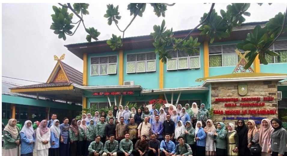
Gambar 3. Foto Bersama Tim Pengabdian Dengan Seluruh Peserta Pelatihan

Pelaksanaan pengabdian memberikan pengetahuan, pengalaman baru dalam berteknologi digital bagi seluruh peserta. Melalui pelaksanaan pengabdian ini peserta mendapatkan pengetahuan tentang menelusuri sumber-sumber sejarah berbasis digital sehingga dapat memperkaya hasanah pengetahuan guru dalam mengintegrasikan sejarah lokal kedalam materi sejarah dan mendapatkan sertifikat pelatihan.