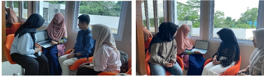
Gambar 4. Proses Pendampingan Tiap Kelompok Mahasiswa

Selama proses pendampingan, ditemukan beberapa kendala yang dihadapi. Mahasiswa cenderung mencampurkan penyajian data dengan interpretasi. Mahasiswa didapati menulis interpretasi di bagian hasil atau sebaliknya, hanya menyajikan data tanpa analisis mendalam di bagian pembahasan. Tim pelaksana memberikan contoh konkret dari artikel jurnal untuk menunjukkan perbedaan jelas antara hasil dan pembahasan. Pendampingan intensif diberikan dengan mengoreksi dan memberikan umpan balik langsung pada draf mahasiswa.