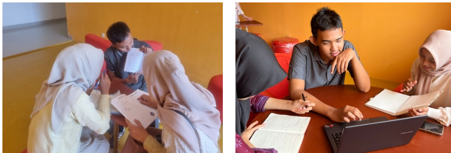
Gambar 3. Proses Diskusi Kelompok Mahasiswa untuk Menyusun Artikel Ilmiah

Penyampaian informasi tidak hanya bersifat informatif, tetapi juga menjadi landasan bagi mahasiswa dalam menjalani tahapan penulisan artikel ilmiah secara bertahap dan reflektif. Pada pendampingan pertama, mahasiswa diminta secara berkelompok untuk mendiskusikan terlebih topik bahasan yang hendak ditargetkan menjadi bahan tulisan artikel ilmiah. Pada proses ini, mahasiswa mendapatkan pengalaman untuk memulai penulisan dengan saling membagi tugas.