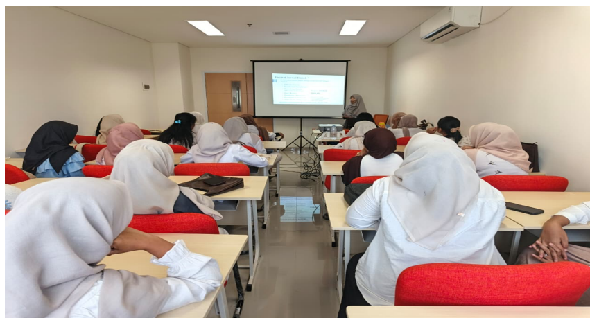
Gambar 2. Pemberian Materi Pelatihan

Mahasiswa juga dibekali pemahaman bahwa penelitian hasil harus bersifat objektif, ringkas dan fokus pada penyajian data tanpa interpretasi. Materi menekankan penggunaan tabel dan grafik secara efisien, perlunya menghindari duplikasi data, serta pemilihan bahasa yang tegas dan sesuai kaidah ilmiah. Penekanan ini penting untuk membantu mahasiswa membedakan antara penyajian hasil dan pembahasan sebab hal ini masih belum dipahami secara mendalam oleh sebagian mahasiswa.