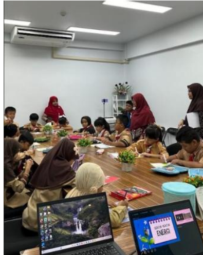
Gambar 3. Kegiatan Implementasi di Sekolah Indonesia Bangkok (SIB)

mengerjakan soal evaluasi, menyampaikan pesan kesan dan pendapat terhadap pembelajaran yang telah dilaksanakan. Selanjutnya guru memberikan pesan moral dan doa bersama sebagai penutup pembelajaran.