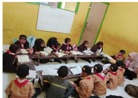
Gambar 2. Siswa Mengikuti Aktivitas Membaca Al-Qur'an dan Mengaji Pagi

Berdasarkan gambar 2 di atas, pendekatan pembiasaan berbasis keagamaan melalui pembiasaan membaca Al-Qur'an di SD Plus Fatimah Az-Zahro adalah membiasakan siswa untuk membaca surah pendek dan do'a harian serta mengaji pagi. Pembiasaan siswa untuk mengaji pagi dilaksanakan selama 90 menit. Pembiasaan tersebut dimaksudkan untuk melatih siswa agar terbiasa dan ringan selalu membaca Al Qur'an di setiap waktu. Hasil observasi