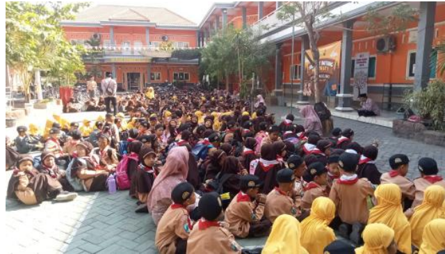
Gambar 5. Kegiatan Istighasah di Halaman Sekolah

Penguatan pendidikan karakter Profil Pelajar Pancasila dimensi beriman dan bertakwa juga dilakukan melalui pembiasaan berdo'a sebelum dan sesudah pembelajaran di kelas. Pelaksanaan pembiasaan berdo'a sebelum dan sesudah pembelajaran dilaksanakan pada setiap hari. Sejalan dengan pernyataan guru, kegiatan pembiasaan berdo'a tersebut merupakan salah satu bentuk penanaman nilai-nilai beriman dan bertakwa yang didampingi oleh guru, agar semua siswa dapat membiasakan diri untuk selalu berdo'a sebelum dan sesudah melakukan sesuatu dalam kehidupan sehari-hari. Bacaan do'a yang dibaca sebelum pembelajaran, adalah membaca surah al-Fatihah, do'a lapang dada serta do'a mau belajar. Sedangkan do'a sesudah belajar yang dibaca adalah surah al-'Ashr dan do'a setelah belajar.