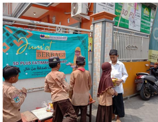
Gambar 7. Pembiasaan Aktivitas Jum'at Berbagi

Jum'at berbagi ini dilaksanakan mulai pukul 10.00 WIB dengan membagikan snack dan minuman seharga Rp10.000,00 kepada masyarakat sekitar yang melintas di depan sekolah. Sejalan dengan hasil wawancara kepada kepala sekolah bahwa pembiasaan Jum'at berbagi diharapkan siswa memiliki rasa peduli terhadap orang lain sebagaimana kegiatan Jumat berbagi yang dilakukan siswa pada gambar 7 di bawah ini.