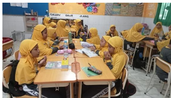
Gambar 6. Pembiasaan Berdo'a Sebelum dan Sesudah Pembelajaran.

Berdasarkan hasil wawancara dengan guru kelas bahwa pembiasaan berdo'a sebelum dan sesudah pembelajaran merupakan pembiasaan yang diterapkan pada siswa fase A untuk membentuk kebiasaan positif dan meningkatkan konsentrasi belajar. Berdasarkan hasil observasi, guru membiasakan berdo'a sebelum dan sesudah pembelajaran dengan metode yang menyenangkan, seperti menggunakan lagu dan gerakan sebelum berdo'a. Sejalan dengan hasil observasi, siswa melaksanakan pembiasaan tersebut dengan bimbingan guru sebagaimana kegiatan pembiasaan berdo'a pada gambar 6 di bawah ini.