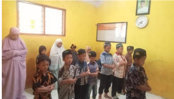
Gambar 3. Pembiasaan Shalat Dhuha

bacaan shalat dengan suara lantang. Hal ini dikuatkan dengan hasil observasi pada kegiatan shalat Dhuha yang dilakukan siswa di kelas fase A sebagaimana pada gambar 3 di bawah ini.