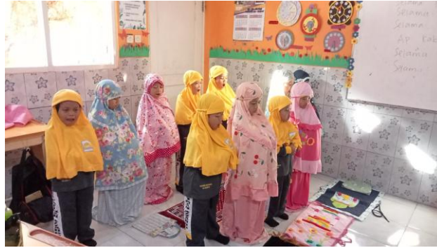
Gambar 4. Shalat Zuhur berjamaah

dikuatkan dengan hasil observasi berkaitan kegiatan pembiasaan shalat Zuhur yang dilakukan siswa di kelas sebagaimana gambar 4 di bawah ini.