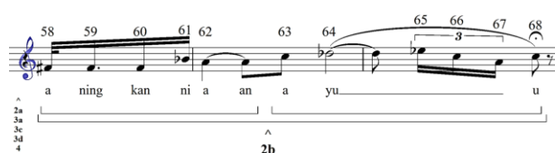
Gambar 8. GPR birama 11-13

3c dan GPR 4. Kelompok dominan yang pertama pada gambar 5 memiliki dua kelompok subordinat yang dipisahkan oleh slur dan istirahat, titik serang yang relatif berbeda serta perbedaan artikulasi. Kemudian, antara n 49 ke 50 memisahkan kelompok subordinat dan dominan. Kelompok subordinat selanjutnya, dimulai dari n 50 sampai n 53 yang kemudian terpisah dari n 54 sampai n 57 oleh GPR 2a dan GPR 3c.