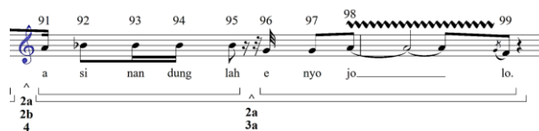
Gambar 10. GPR birama 16-17

serang kembali muncul pada pemisahan kelompok subordinat dengan akhir n 81. Selain itu, terdapat GPR 2a pada bagian tersebut.