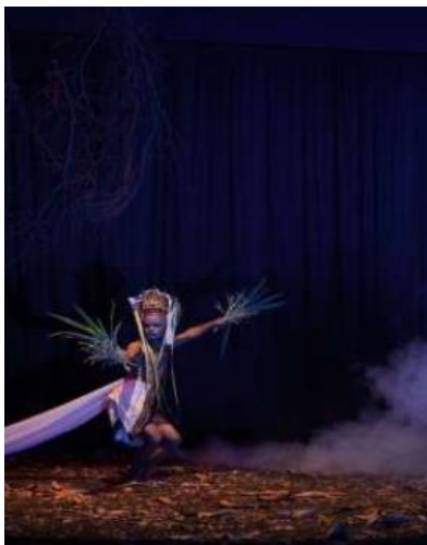
Gambar 4. Pengenalan Dukun Besale

penanda penting, berfungsi sebagai transisi spiritual sebelum masuk ke momen kerasukan. Akhir dari bagian ini menandai keberhasilan binding spiritual dan dimulainya komunikasi spiritual untuk mencari petunjuk penyembuhan.