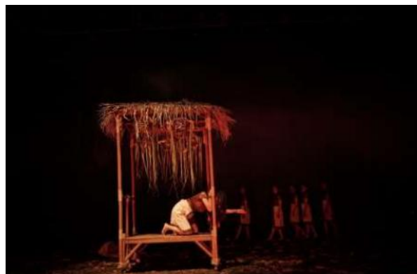
Gambar 7. Dampak dari Pelanggaran, Pasien tidak Terselamatkan