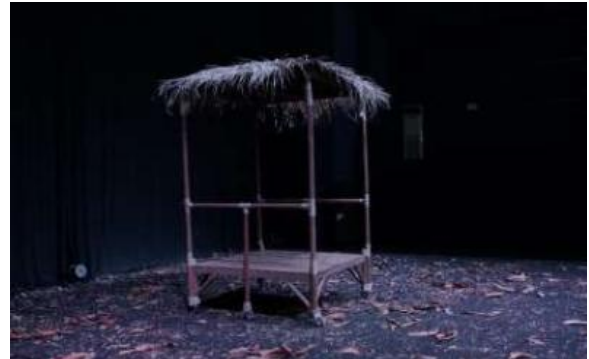
Gambar 9. Setting Panggung (Dokumentasi: Sukma, 2025)

penyelesaian atau akhir naratif, dalam hal ini, diterimanya takdir spiritual pasien.