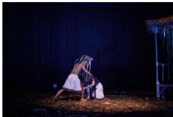
Gambar 6. Pelanggaran Terhadap Rnorma atau Ketentuan Ritual Besale yakni Dukun dan Pasien Tidak Boleh Bertemu Selama 40 Hari

Penurunan intensitas dalam resolusi dicapai melalui perubahan tempo musik yang melunak dan dinamika gerak yang menjadi lebih tenang dan terfokus. Tujuan dari bagian ini adalah mengembalikan rasa harmoni dan keteraturan kosmis, baik melalui hasil penyembuhan yang membawa kedamaian atau melalui penerimaan konsekuensi spiritual yang harus dipikul. Akhir karya ini menekankan filosofi Suku Anak Dalam mengenai urgensi menjaga keseimbangan spiritual dan ketaatan terhadap perintah leluhur.