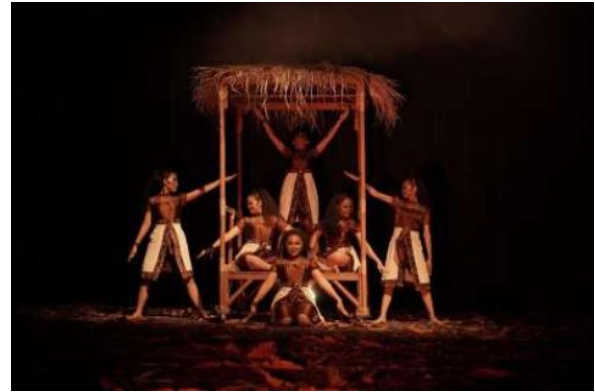
Gambar 2. Suasana Suku Anak Dalam yang Damai

Bagian ini menginterpretasikan suasana kegelisahan dan keputusan yang melanda komunitas adat. Gerak yang dikembangkan masih memiliki pola teratur, namun sudah disisipi motif-motif kecil yang mengisyaratkan kekhawatiran dan ketidakberdayaan. Pengkarya memanfaatkan penataan ruang yang berubah, dari luas menjadi terfokus di sekitar tokoh yang sakit, untuk mempertegas sumber masalah. Eksposisi ini secara emosional meletakkan dasar pembenaran bagi peningkatan dramatik yang akan muncul pada bagian klimaks.