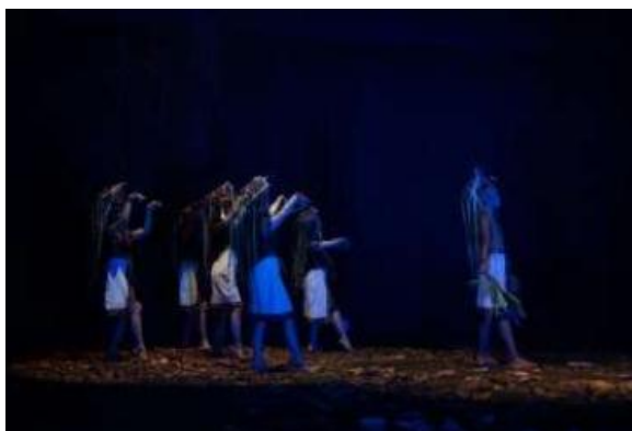
Gambar 5. Prosesi Ritual Besale