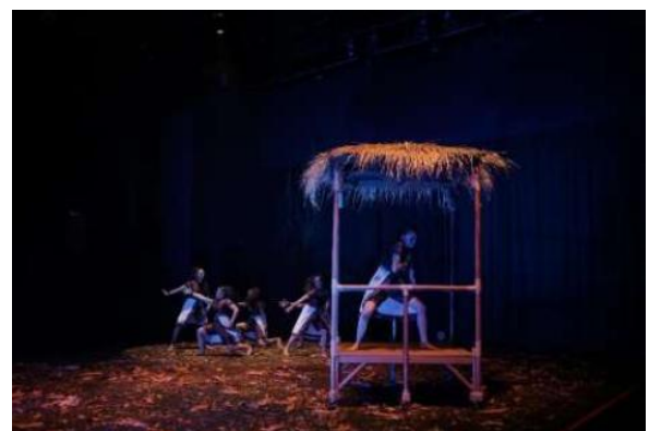
Gambar 3. Pengenalan Munculnya Penyakit Gaib