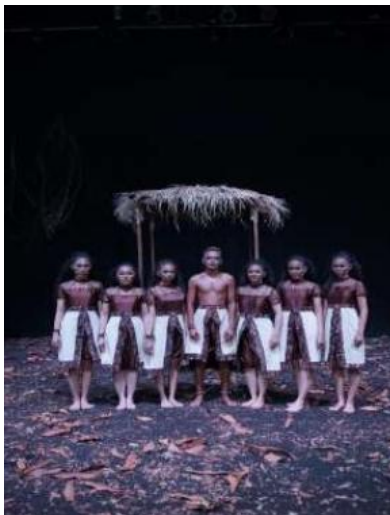
Gambar 8. Foto Kostum Penari

Tata busana karya Simpuh Ruh dirancang untuk mencerminkan identitas kultural Suku Anak Dalam serta status keramat sang dukun sale . Pemilihan kostum bersifat minimalis dan menggunakan material yang memiliki kedekatan dengan alam sekitar, sesuai dengan konteks tempat ritual. Busana yang dikenakan oleh dukun sale dibuat berbeda dari penari komunal lainnya. Perbedaan visual ini bertujuan menegaskan peran dukun sebagai mediator spiritual yang menjadi pusat perhatian dalam drama tari.