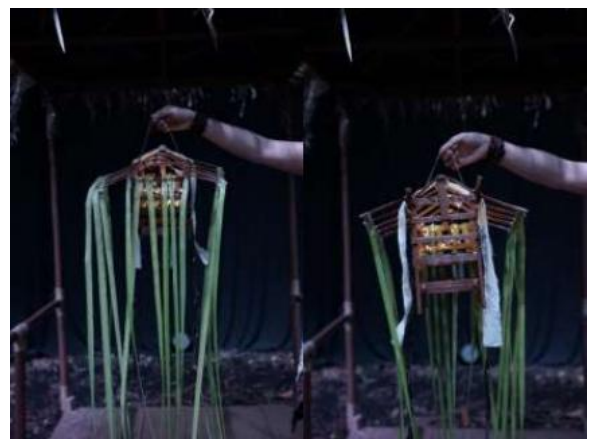
Gambar 10. Properti Balai Terbang Kecil yang Digunakan di Atas Kepala Penari

Properti pementasan digunakan sebagai simbol visual yang esensial untuk memperkuat narasi dan suasana sakral ritual. Properti utama yang dimanfaatkan adalah Balai Terbang, yakni replika struktur kecil yang berfungsi sebagai pusat kontak spiritual dalam ritual aslinya. Kehadiran Balai Terbang menjadi penanda lokasi keramat dan titik fokus bagi pergerakan dukun di panggung. Penggunaan daun-daunan dan elemen alam lainnya melengkapi properti, menegaskan koneksi erat antara komunitas SAD dengan alam sebagai sumber pengobatan tradisional mereka.