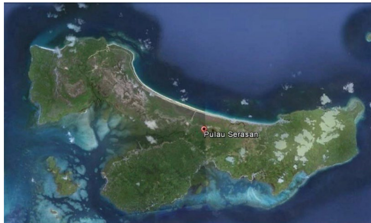
Gambar 1. Peta Kecamatan Serasan