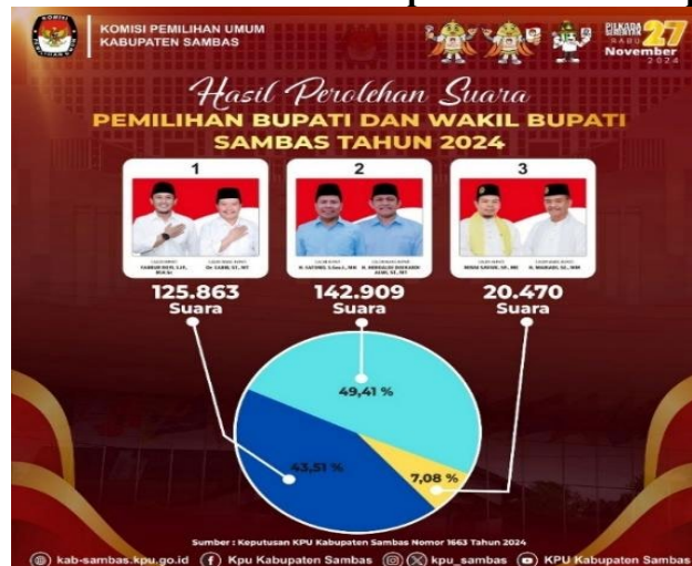
Gambar 1. Perolehan Suara Pemilihan Bupati dan Wakil Bupati Sambas 2024