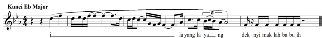
Gambar 2. Tonalitas lagu Krinok

Berdasarkan hasil analisis, peneliti menemukan bahwa scale Krinok tidak dipertahankan pada lagu Tengah Malam . Hal tersebut dapat dilihat sebagai berikut: