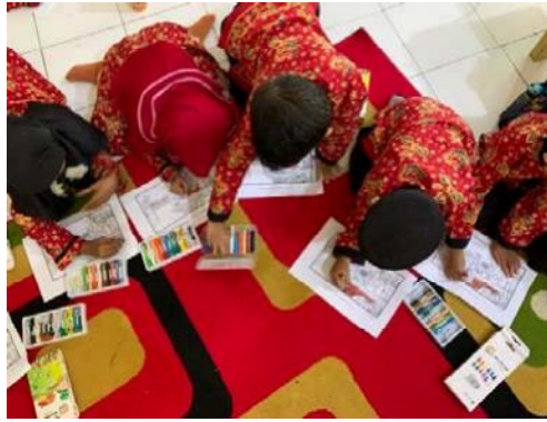
Gambar 3. anak mewarnai lingkungan sekolah yang indah dan bersih

Pertemuan kedua dilakukan pada tanggal 26 November 2022, sebelum memulai kegiatan bercerita digital terlebih dahulu mempersiapkan perlengkapan untuk bercerita digital, seperti: Laptop, proyektor, layar proyektor tripod , pengeras suara, dan tong sampah untuk membuang daun kering dan sampah plastik.