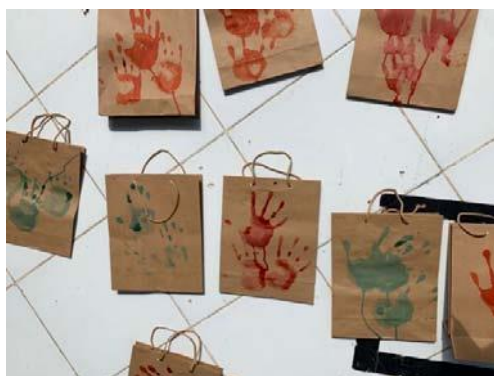
Gambar 9. anak mencap kantong kertas dengan jari tangan