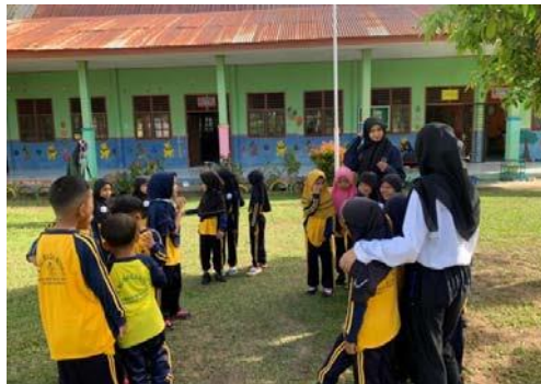
Gambar 13. membagi anak menjadi 4 tim

Setelah membagi tim, kegiatan selanjutnya adalah mengajak anak untuk mengisi penyiram tanaman dengan air bergiliran pertim. Selanjutnya anak diajak untuk menyiram bunga bergantian dengan teman setim, setiap anak mendapatkan kesempatan untuk menyiram bunga.