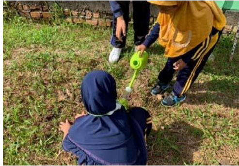
Gambar 18. anak bergiliran menyiram bunga setelah ditanam

Kesadaran anak yang mulai tumbuh dibuktikan dengan dokumentasi kegiatan saat kegiatan puncak acara yaitu menyiram dan menanam bunga dengan bergiliran dan tertib, ditunjukkan pada gambar 18 dan 19.