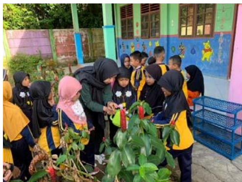
Gambar 14. mengisi penyiram tanaman dengan air secara bergiliran

Setelah membagi tim, kegiatan selanjutnya adalah mengajak anak untuk mengisi penyiram tanaman dengan air bergiliran pertim. Selanjutnya anak diajak untuk menyiram bunga bergantian dengan teman setim, setiap anak mendapatkan kesempatan untuk menyiram bunga.