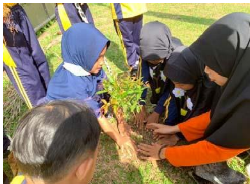
Gambar 17. memadatkan tanah setelah ditanami bunga

Hasil evaluasi dan mentoring yang dilakukan oleh tim penulis di TK Al-Badariyah, Kec. Muara Bulian menunjukkan bahwa anak sudah mulai paham dan menunjukkan perilaku cinta lingkungan yang ditandai dengan adanya tong sampah organik dan anorganik dimana anak dapat memilah dan membuang sampah di tong sampah yang tepat, selain itu penggunaan kantong plastik mulai berkurang karena anak beralih menggunakan kantong kertas yang telah dihias sendiri untuk meletakkan belanjannya.