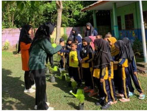
Gambar 12. memberikan pengarahan kepada anak sebelum memulai kegiatan menanam bunga