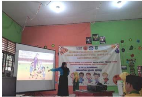
Gambar 6. kegiatan bercerita digital tema “Anak Hebat, Penyelamat Bumi”