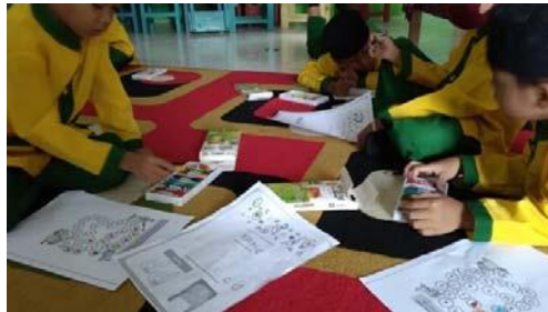
Gambar 7. anak mewarnai maze mencari jalan menuju tong sampah dan menulis kata P-L-A-S-T-I-K

Pertemuan keempat dilaksanakan pada tanggal 29 November 2022. Peralatan yang dipersiapkan sebelum memulai cerita digital seperti laptop, proyektor, layar proyektor tripod , pengeras suara, mikrofon, kantong kertas dan pewarna makanan untuk menghias tas kertas dengan menggunakan cap jari.