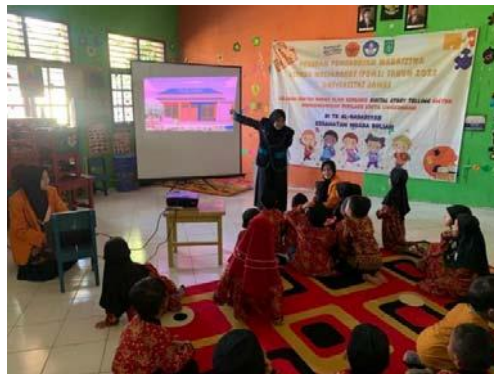
Gambar 2. kegiatan bercerita digital tema "Anak Hebat Buang Sampah Pada Tempatnya"

Pertemuan pertama dilaksanakan di salah satu ruang kelas TK Al-Badariyah pada tanggal 24 November 2022. Peralatan yang dipersiapkan sebelum memulai cerita digital seperti laptop, proyektor, layar proyektor tripod , pengeras suara, dan LKPD tema "Mewarnai lingkungan sekolah yang indah dan bersih" sebagai implementasi setelah mendengarkan cerita digital disajikan dalam gambar 2 dan 3.