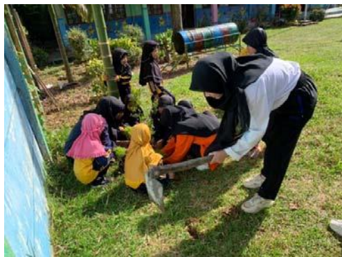
Gambar 16. menggali tanah sebelum ditanami bunga

Puncak kegiatan adalah menanam bunga, sebelum bunga ditanam tim penulis terlebih dahulu menggali tanah agar dapat ditanami bunga dan mengajarkan anak bagaimana cara melepaskan polybag dan memadatkan tanah setelah bunga ditanam.