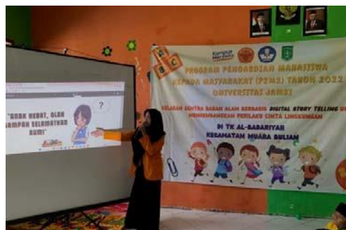
Gambar 8. kegiatan bercerita digital tema “Anak Hebat Olah Sampah, Selamatkan Dunia”

Pertemuan keempat dilaksanakan pada tanggal 29 November 2022. Peralatan yang dipersiapkan sebelum memulai cerita digital seperti laptop, proyektor, layar proyektor tripod , pengeras suara, mikrofon, kantong kertas dan pewarna makanan untuk menghias tas kertas dengan menggunakan cap jari.