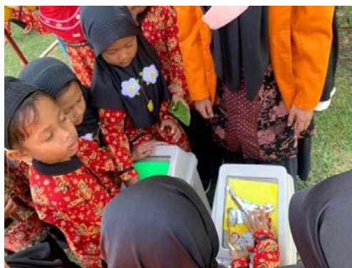
Gambar 5. anak memilah sampah organik dan sampah anorganik

Pertemuan ketiga dilaksanakan pada tanggal 28 November 2022. Sebelum bercerita terlebih dahulu mempersiapkan perlengkapan untuk bercerita digital, seperti: Laptop, proyektor, layar proyektor tripod , pengeras suara, dan LKPD "Mewarnai Maze Mencari Jalan Menuju Tong Sampah" dan "Menulis Kata P-L-A-S-T-I-K" sebagai implementasi setelah mendengarkan cerita digital.