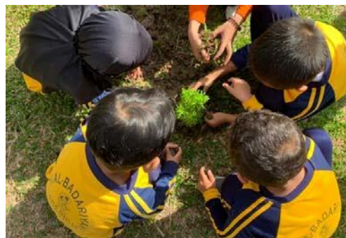
Gambar 19. anak menanam bunga