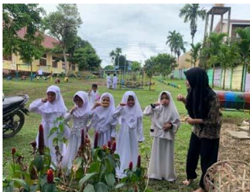
Gambar 11. anak belajar menyikat gigi dengan benar tanpa boros air

Selama kegiatan bercerita digital berlangsung, anak merasa sangat antusias dan kegiatan dilakukan secara interaktif dengan cara mengajak anak terlibat langsung dalam cerita dan anak memberikan umpan balik dengan bertanya dan menjawab pertanyaan yang dilontarkan selama sesi bercerita berlangsung.