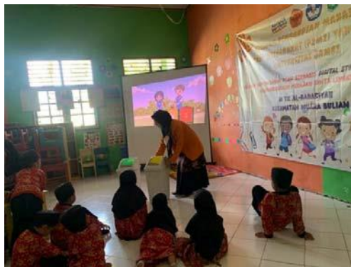
Gambar 4. kegiatan bercerita digital tema "Anak Hebat Pandai Memilah Sampah, Selamatkan Dunia"

Pertemuan kedua dilakukan pada tanggal 26 November 2022, sebelum memulai kegiatan bercerita digital terlebih dahulu mempersiapkan perlengkapan untuk bercerita digital, seperti: Laptop, proyektor, layar proyektor tripod , pengeras suara, dan tong sampah untuk membuang daun kering dan sampah plastik.