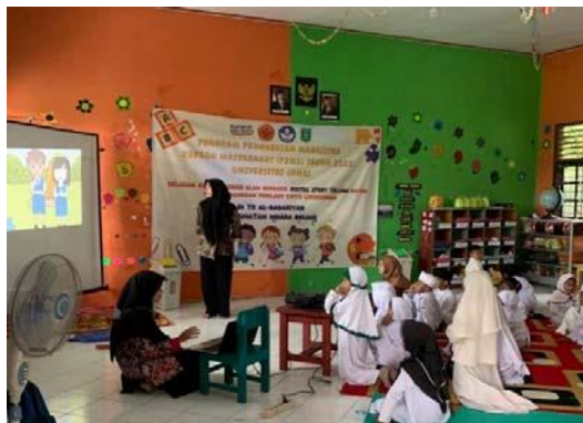
Gambar 10. kegiatan bercerita digital tema “Anak Hebat Hemat Air, Selamatkan Bumi”

Pertemuan kelima dilakukan pada tanggal 2 Desember 2022, sebelum memulai kegiatan bercerita digital terlebih dahulu mempersiapkan perlengkapan untuk bercerita digital, seperti: Laptop, proyektor, layar proyektor tripod , pengeras suara, mikrofon dan perlengkapan untuk menyikat gigi (pasta gigi, sikat gigi, gayung) sebagai implementasi setelah mendengarkan cerita digital.