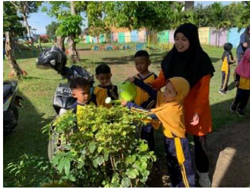
Gambar 15. anak menyiram bunga bergiliran dengan teman setimnya

Puncak kegiatan adalah menanam bunga, sebelum bunga ditanam tim penulis terlebih dahulu menggali tanah agar dapat ditanami bunga dan mengajarkan anak bagaimana cara melepaskan polybag dan memadatkan tanah setelah bunga ditanam.