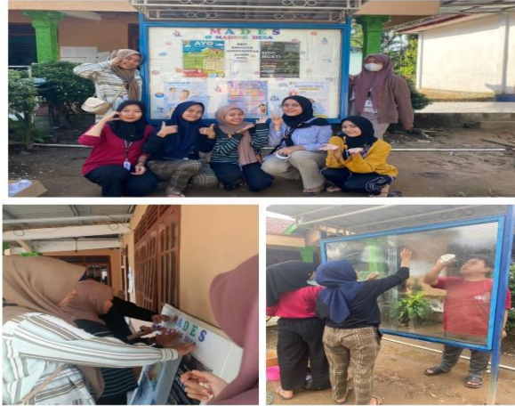
Gambar 4. Pembuatan Mading Desa

Kegiatan ini diharapkan dapat dilaksanakan secara berkelanjutan oleh aparat desa maupun masyarakat dan di isi dengan kreativitas anak-anak dan remaja di Desa Sido Mukti.