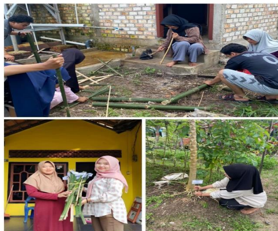
Gambar 2. Pembuatan dan Penyerahan Papan Nama Toga

Tahap terakhir adalah pembagian dan pemasangan papan nama tanaman toga pada masing-masing RT. Pemasangan papan nama TOGA dilakukan bersama masyarakat dan ibu-ibu PKK di dekat tanaman Toga yang ditanami TOGA sehingga dapat mengedukasi masyarakat yang datang berkunjung.