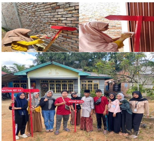
Gambar 3. Pembuatan dan Penyerahan Plang Aparat Desa

Papan plang yang sudah siap selanjutnya dilakukan pemasangan di depan halaman rumah aparat desa. Pemasangan dilakukan oleh mahasiswa KKN dan dibantu oleh aparat desa untuk mempermudah pemasangan. Dengan adanya papan plang penunjuk rumah Perangkat Desa, Kadus, dan ketua RT, maka akan mempermudah masyarakat untuk menemukan tempat yang ingin dituju.