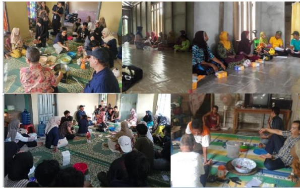
Gambar 1. Penyuluhan dan bimbingan teknis

Teknik pembuatan permen nenas dilakukan sesuai diagram alir yang disajikan pada Gambar 2. Ekstrak nenas dibuat dengan cara memblender nenas sebanyak 500 g ditambah air sebanyak 250 g lalu diperas untuk dipisahkan ampasnya. Sebanyak 650 ml ekstrak nenas selanjutnya dipanaskan dalam kuah hingga mendidih sambil diaduk. Setelah itu gula pasir sebanyak 500 g dimasukkan, pemanasan dan pengadukan terus dilanjutkan. Setelah terbentuk buih dan air semakin banyak teruapkan, tambahkan glukosa dan garam masing-masing sebanyak 150 dan 5 g, terus lakukan pengadukan. Setelah buih semakin banyak dan suhu semakin meningkat kecilkan api kompor hingga suhu adonan tidak melebihi 130°C. Pengaturan besar kecilnya api kompor bisa saja dilakukan berulang kali agar suhu adonan benar-benar dapat dijaga tidak menyebabkan karamelisasi gula dan proses kristalisasi dapat berlangsung cepat. Setelah adonan mulai lengket (kristalisasi gula sudah terjadi secara intensif, ditandai oleh massa adonan yang tidak lagi buyar dan melarut saat dicelupkan di air dingin), api kompor dimatikan dan pengadukan tetap dilanjutkan secara intensif. Tahap selanjutnya adonan dipindahkan ke cetakan dan didinginkan. Setelah dingin permen nenas dilepaskan dari cetakan, dibungkus dengan plastik dan dikemas untuk selanjutnya siap didistribusikan.