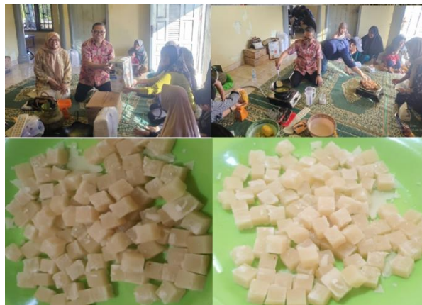
Gambar 3. Demonstrasi dan pelatihan pembuatan permen nenas

Penerapan teknologi dalam pembuatan permen nenas di Desa Tangkit Baru, Kabupaten Muaro Jambi, merupakan upaya untuk memberdayakan masyarakat dan mengoptimalkan potensi sumber daya lokal. Inovasi produk berbasis lokal menjadi sangat penting, sebagaimana ditunjukkan oleh Rosana (2021) dan didukung oleh penelitian sejenis mengenai penguatan literasi teknologi masyarakat melalui program berbasis praktik (Purwanto et al., 2022). Teknologi dalam proses produksi terbukti meningkatkan keterampilan, pemahaman, serta kualitas produk lokal (Herawan, 2024; Sudianto & Sutopo, 2025).