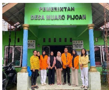
Gambar 2. kegiatan obsevasi

Hasil dari observasi yang telah dilakukan di Desa Muaro Pijoan, Kecamatan Jambi Luar Kota, Kabupaten Muaro Jambi menunjukkan bahwa masyarakat kurang memahami pemanfaatan sumber daya yang ada di sekitar desa yang sangat bermanfaat bagi sektor pertanian (Krisjuyani, 2023; Marlina, Hanifan, & Krisna Chandra, 2020; Syaifudin & Ma'ruf, 2022).