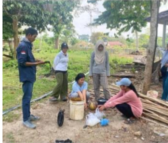
Gambar 3. Persiapan alat dan bahan

Langkah awal dalam pembuatan Pupuk Organik Cair (POC) adalah mempersiapkan alat dan bahan. Bahan yang digunakan meliputi 250 ml air tebu, 50 g Trikoderma, 250 ml urin kambing, 10 L air kelapa, dan 10 L air cucian beras. Untuk peralatan yang diperlukan dalam pembuatan pupuk organik cair (POC) ini adalah ember dengan kapasitas lebih dari 20 liter, kayu pengaduk, timbangan, gelas ukur, plastik hitam, sedotan atau selang kecil, dan tali rafia.