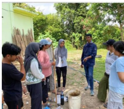
Gambar 4. Pembuatan POC

Langkah pertama yang harus dilakukan adalah menuangkan 250 ml air perasan tebu ke dalam ember, lalu menambahkan 250 ml urin kambing, dilanjutkan dengan memasukkan Trikoderma dan mengaduknya menggunakan kayu pengaduk hingga merata. Selanjutnya, masukkan air kelapa dan air bekas cucian beras, kemudian aduk kembali hingga homogen. Setelah itu, tutup ember dengan plastik dan ikat dengan baik. Buat lubang kecil pada tutup plastik seukuran pipa kecil atau sedotan, yang berfungsi untuk membiarkan gas keluar dari pupuk organik cair (POC) yang dibuat. Pupuk ini kemudian dibiarkan atau difermentasi selama 14 hari atau lebih, disimpan di tempat yang teduh tanpa dibuka hingga proses fermentasi selesai (Athallah, Bagio, Yusrizal, & Handayani, 2020; Ekawati, Rizieq, Ellyta, Masulili, & Sutikarini, 2022; Haeruddin, Kusmiah, Arya, & Rudi, 2022; Madyaningrana, Budiarmo, Ariestanti, Pandapotan, & Sinaga, 2022; Netti Herawati et al., 2023; Surtiningsih, Fatimah, Ni'matuzahroh, Supriyanto, & Nurhariyati, 2020).