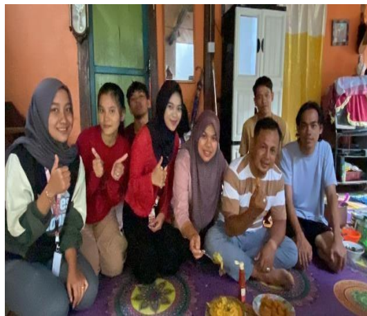
Gambar 2 Percobaan Pembuatan Tepek Ikan Bersama Ketua PKK Dan Bapak Kades

Selain itu, percobaan ini juga menjadi ajang bagi masyarakat untuk belajar tentang cara mengolah ikan dengan cara yang berbeda, yang sebelumnya tidak mereka ketahui. Meskipun ada kekurangan pada rasa di percobaan pertama, hasil akhir produk sudah memenuhi standar visual yang menarik dan layak dipasarkan.