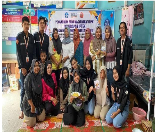
Gambar 5 Penyuluhan Dan Demonstrasi

Demonstrasi pengolahan dan pengemasan produk dilakukan di hadapan ibu-ibu PKK dan beberapa perwakilan masyarakat. Kegiatan ini tidak hanya bertujuan untuk memberikan pengetahuan, tetapi juga untuk memperkenalkan produk olahan ikan kepada masyarakat secara langsung. Selain itu, tim KKN juga memberikan pelatihan mengenai cara mendapatkan sertifikasi produk, yang merupakan langkah penting untuk membangun kredibilitas dan kepercayaan konsumen terhadap produk.