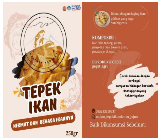
Gambar 3 Kemasan Tepek Ikan