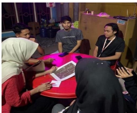
Gambar 1 Focus Group Discussion (FGD) Bersama Bumdes Untuk Mengumpulkan Data Potensi Ikan Danau

Salah satu kegiatan awal yang dilakukan oleh tim KKN adalah pengumpulan data mengenai potensi ikan yang ada di Danau Kerinci. Berdasarkan wawancara dengan Kepala Desa Jujun, Ketua BUMDes, serta Ketua PKK, ditemukan bahwa meskipun ikan di danau tersebut melimpah, masyarakat belum memanfaatkan potensi ikan tersebut secara optimal. Mayoritas ikan seperti ikan mujair, saluang, dan gabus hanya dijual dalam bentuk segar tanpa diproses lebih lanjut. Hal ini menjadi masalah, karena harga ikan segar cenderung tidak stabil dan dapat menurunkan pendapatan nelayan (Apituley, Soukotta, & Wattimury, 2023; Flukeria, 2022). Oleh karena itu, tim KKN memperkenalkan pengolahan ikan menjadi produk yang bernilai tambah, seperti tepek ikan dan nugget ikan, yang diharapkan dapat meningkatkan ketahanan pangan dan memberikan pendapatan tambahan bagi masyarakat (Ahmad, Hariani, & Wiralis, 2022; Faisal, 2021; Fradinata, Kesuma, & Rahayu, 2022; Kaimudin, Sumarsana, Radiena, & Noto, 2021; Kusumawardani, Puspitasari, Harfana, & Supadmi, 2022; Malagapi, Yuniarti, & Wiryati, 2020; Nur azizah, Syamsul, Yusuf, Dian Nurcahyani, & Nur intang, 2023; Rais & Patang, 2019).