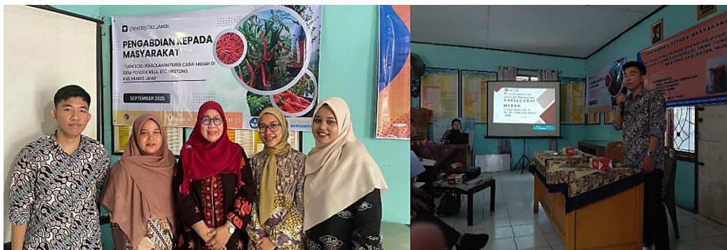
Gambar 2. Tim Pengabdian Masyarakat (Kiri), Dan Kegiatan Penyuluhan Serta Demonstrasi Pengolahan Cabai Merah Menjadi Puree (Kanan)

Pengemasan merupakan salah satu cara yang efektif untuk melindungi produk dari kerusakan fisik, mekanis, dan mikrobiologis, sekaligus menghambat proses respirasi dan transpirasi sehingga produk tidak mudah busuk dan keriput, serta mampu memperpanjang umur simpan (Julitasari & Suwarta, 2020). Hal ini sejalan dengan hasil penelitian Renate (2009) yang menyatakan bahwa pemilihan jenis kemasan yang tepat pada puree cabai merah sangat berpengaruh terhadap kestabilan mutu produk selama penyimpanan.