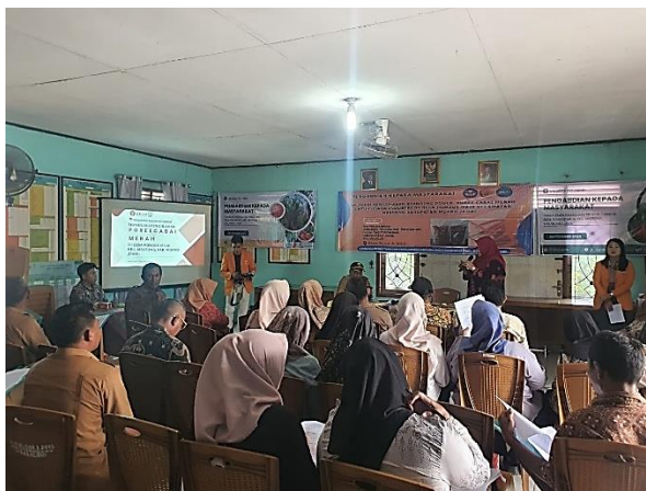
Gambar 1. Mitra Peserta Kegiatan Pengabdian Masyarakat

kepada peserta, yaitu penerapan teknologi pengolahan cabai merah menjadi puree sebagai salah satu upaya untuk meningkatkan nilai tambah komoditas cabai di tingkat masyarakat. Materi yang diberikan meliputi potensi pemanfaatan cabai merah sebagai bahan baku produk olahan, pentingnya penanganan pascapanen yang tepat, serta peluang pengembangan usaha berbasis puree cabai merah. Pengolahan cabai menjadi produk setengah jadi, seperti puree , merupakan salah satu bentuk diversifikasi produk yang dapat memperpanjang masa simpan bahan baku sekaligus meningkatkan nilai ekonomi komoditas hortikultura.