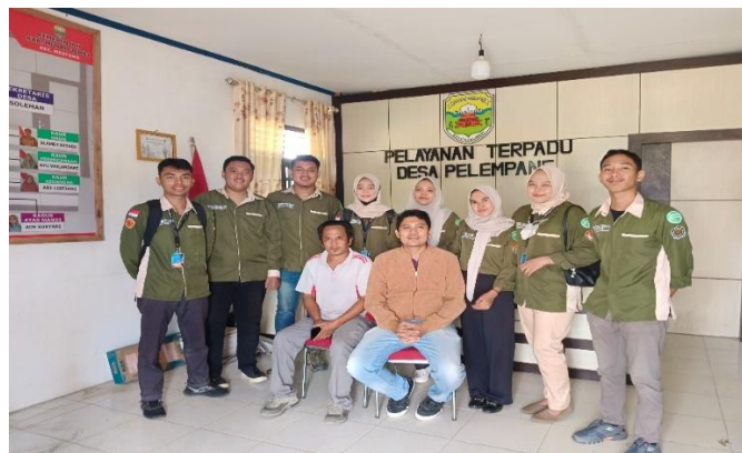
Gambar 3. Sosialisasi dengan Pemerintahan Desa