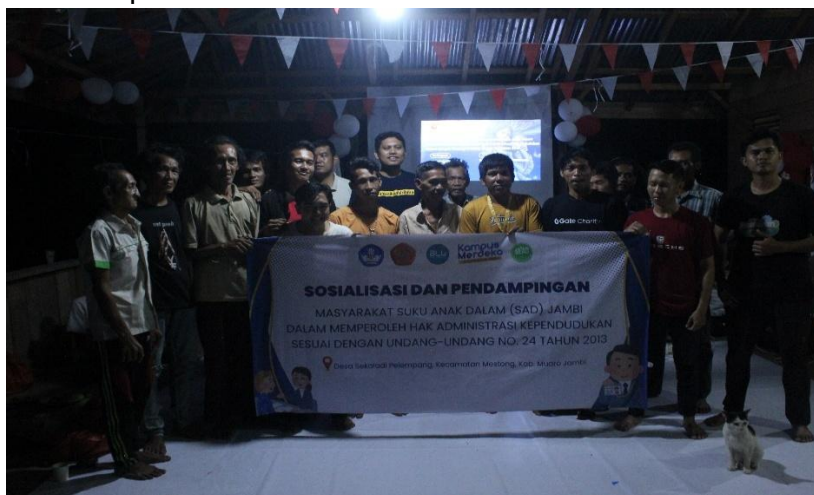
Gambar 1. Sosialisasi dan Pendampingan Masyarakat Suku Anak Dalam (SAD) Jambi.

itu, pentingnya sosialisasi dan pendampingan bagi masyarakat SAD dalam memperoleh hak administrasi kependudukan sesuai dengan Undang-Undang Nomor 24 Tahun 2013 Tentang Administrasi Kependudukan.