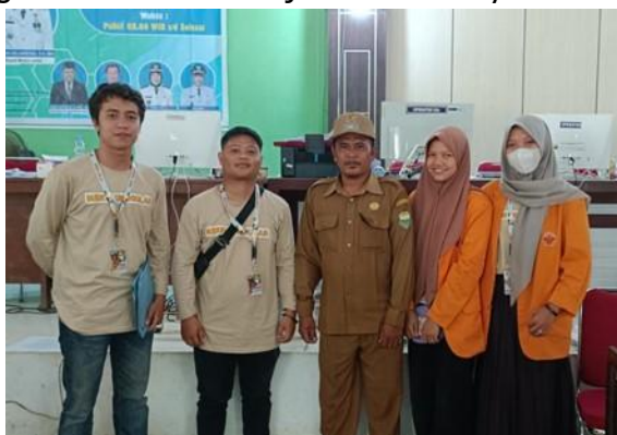
Gambar 4. Pendataan Masyarakat Suku Anak Dalam (SAD) Jambi di DUKCAPII

Kegiatan pendampingan ini diharapkan dapat terus berkelanjutan, sehingga manfaatnya tidak hanya dirasakan sesaat, tetapi juga memberikan dampak jangka panjang dalam memperkuat integrasi sosial dan kesejahteraan masyarakat SAD Jambi.