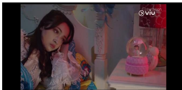
Gambar 3 Kamar Naya

Berikut adalah gambar yang menunjukkan adanya latar kamar Naya.