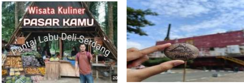
Gambar 2. Pasar KAMU Deli Serdang

intervensi pemerintah atau modal besar, namun bisa dijalankan secara mandiri dengan prinsip gotong royong dan akuntabilitas.