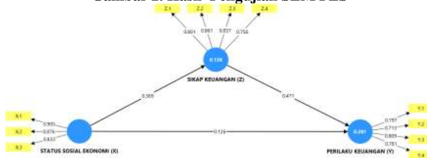
Gambar 2. Hasil Pengujian SEM PLS

Aplikasi perangkat lunak Microsoft Excel dimanfaatkan Ketika memasukkan dan mengolah data dalam studi ini. Peneliti kemudian menggunakan SmartPLS versi 4 untuk memasukkan dan menghitung data untuk setiap indikator.