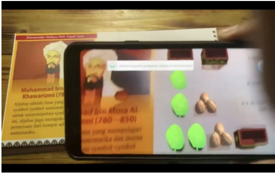
Gambar 4. tangkapan layar penggunaan video pembelajaran terintegrasi Augmented Reality

Modul matakuliah Kapita Selekt Matematika Sekolah Menengah Pertama dapat dimanfaatkan oleh mahasiswa yang sedang menempuh kuliah Kapita Selekt Matematika Sekolah Menengah Pertama. Dari hasil pengamatan yang telah dilakukan, ternyata selama ini mahasiswa masih mengalami kesulitan menemukan bahan ajar matakuliah Kapita Selekt Matematika Sekolah Menengah Pertama. Hasil inovasi ini merupakan salah satu sumbangan pemikiran tim peneliti yang dapat diberikan kepada mahasiswa dan pengajar Kapita Selekt Matematika Sekolah Menengah Pertama agar modul tersebut dapat dioptimalkan sebagaimana mestinya sehingga kemanfaatan alat tersebut dapat dirasakan bagi mahasiswa dalam memahami materi Kapita Selekt Matematika Sekolah Menengah Pertama.