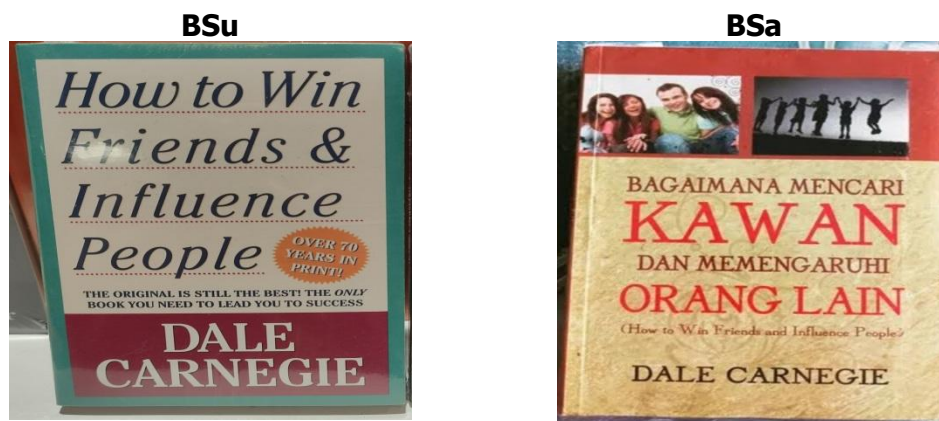
How to Win Friends & Influence People