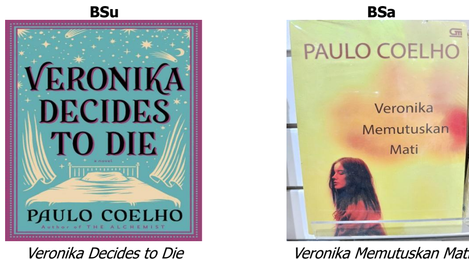
Gambar 4 Datum 73F

Data di atas menampilkan bentuk kalimat pada kedua BSu dan BSa. Struktur pada BSu merupakan kalimat deklaratif sederhana yang terdiri atas subjek, predikat, dan pelengkap. Subjek pada kalimat ini adalah nomina "Veronika" yang merupakan nama tokoh dalam buku. Predikat pada kalimat ini adalah verba "decides" (bentuk present tense orang ketiga tunggal) dan pelengkap yang menyempurnakan maknanya adalah verba infinit "to die".