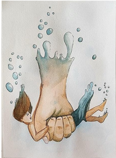
Gambar 1 Sinking in My Own Blue Dokumentasi: Tim peneliti. 2025

pendekatan simbolik pada tubuh, seperti tangan besar yang menggenggam tubuh dengan buih-buih air berwarna biru.